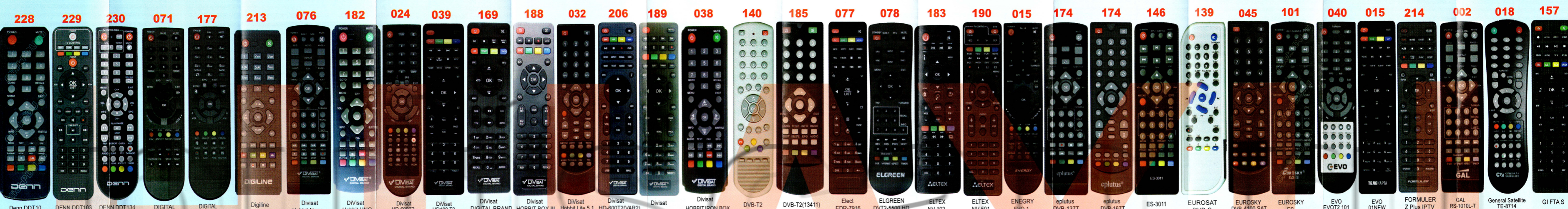
228 Denna DDT10 229 Denna DDT103 230 Denna DDT134 071 DIGITAL 177 DIGITAL Set_Top_Box_DTS53 213 Digiline GHB-898 076 Divisat Hobbit Nano 182 Divisat Hobbit UNO 024 Divisat HD-600T2 039 Divisat HD100 T2 169 Divisat DIGITAL BRAND 188 Divisat HOBBIT BOX III 032 Divisat Hobbit Lite 5.1 206 Divisat HD-600T2(VAR2) 189 Divisat 038 Divisat HOBBIT IRON BOX 140 DVB-T2 185 DVB-T2(13411) 077 Elect EDR-7916 078 ELGREEN DVT2-5500 HD 183 ELTEX NV-102 190 ELTEX NV-501 015 ENERGY EVO-1 174 eplutus DVB-137T 174 eplutus DVB-167T 146 ES-3011 139 EUROSAT DVB-S 045 EUROSKY DVB 4100 SAT 101 EUROSKY ES 040 EVO EVOT2 101 015 EVO 01NEW 214 FORMULER Z Plus IPTV 002 GAL RS-1010L-T 018 General Satellite TE-8714 157 GI FTA S