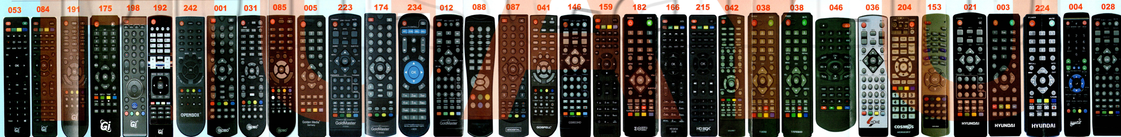
053 Gi Fly 084 Gi HD SLIM 191 Gi HD SLIM COMBO 175 Gi S1013 198 Gi SPARK2 COMBO 192 Gi UNI 242 Globo S3 Micro HD 001 GLOBO GL60 E-RCU-018 031 GLOBO GL50 085 GLOBO E-RCU-012 005 Golden Media Mania 3 HD 223 GoldMaster T737HD1 174 GoldMaster T-303SD 234 GOLDMASRET I-905 012 GoldMaster T-707HD 088 Goldeninterstar 087 GODIGITAL 1306 041 GOSPELL GN1345 146 GS8833HD 159 HD CA CLASS GI HD FTA 182 HD 501RU, T34 166 HD BOX 2018 215 HD BOX T2 PRO 042 HOB797 57G DVB-T 038 HOB818 T-303SD 038 HOB819 T-707HD&HDI 046 HOB821 303SD mini 036 HOME BY-628 DVB 204 HORIZONT 153 HSR529 DVB 021 Hyundai DVB0112 003 Hyundai H-DVB03T2 224 Hyundai H-DV/B560 004 iconBIT HDR21DVD 028 KASKAD DVB-T-2