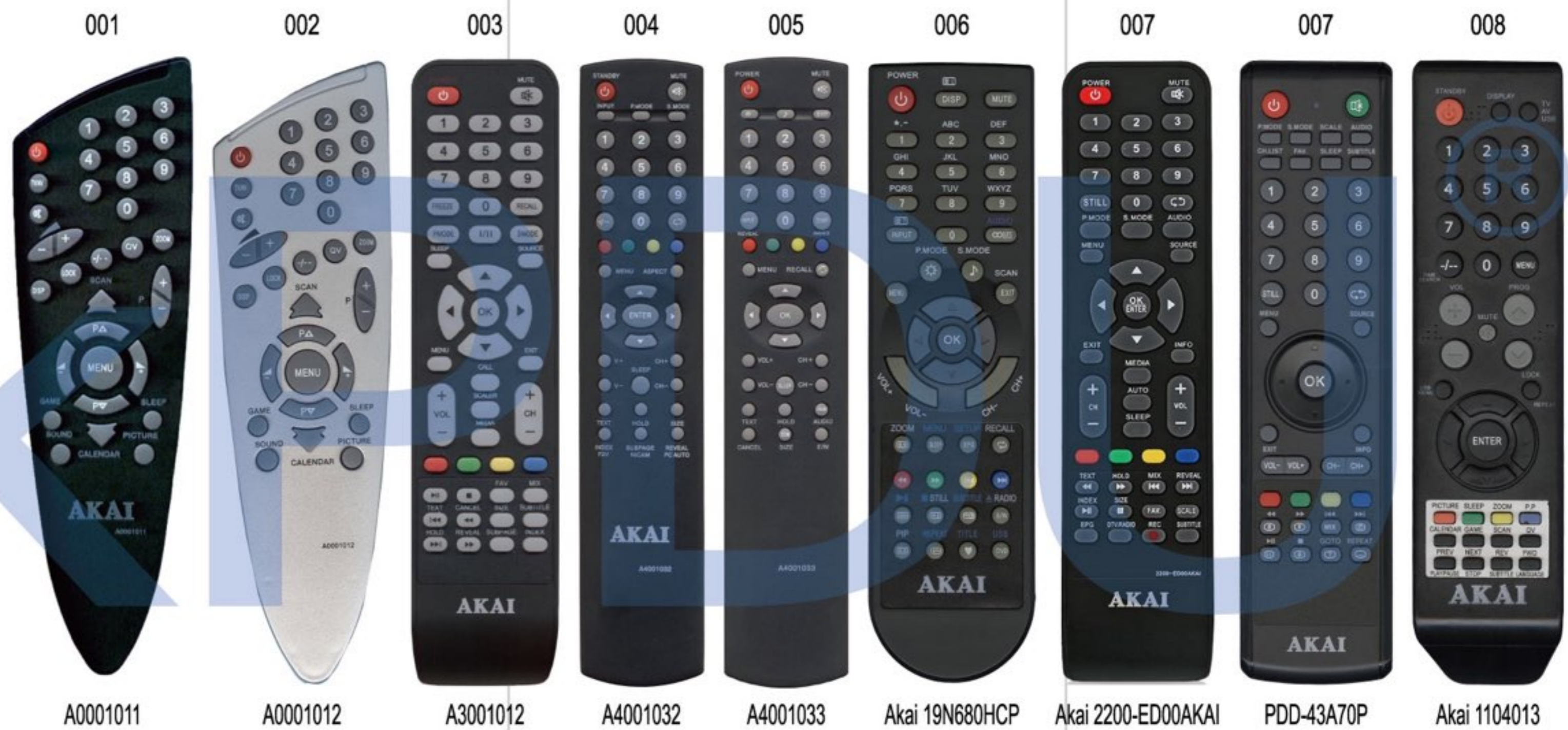
A0001011 A0001012 A3001012 A4001032 A4001033 Akai 19N680HCP Akai 2200-ED00AKAI PDD-43A70P Akai 1104013