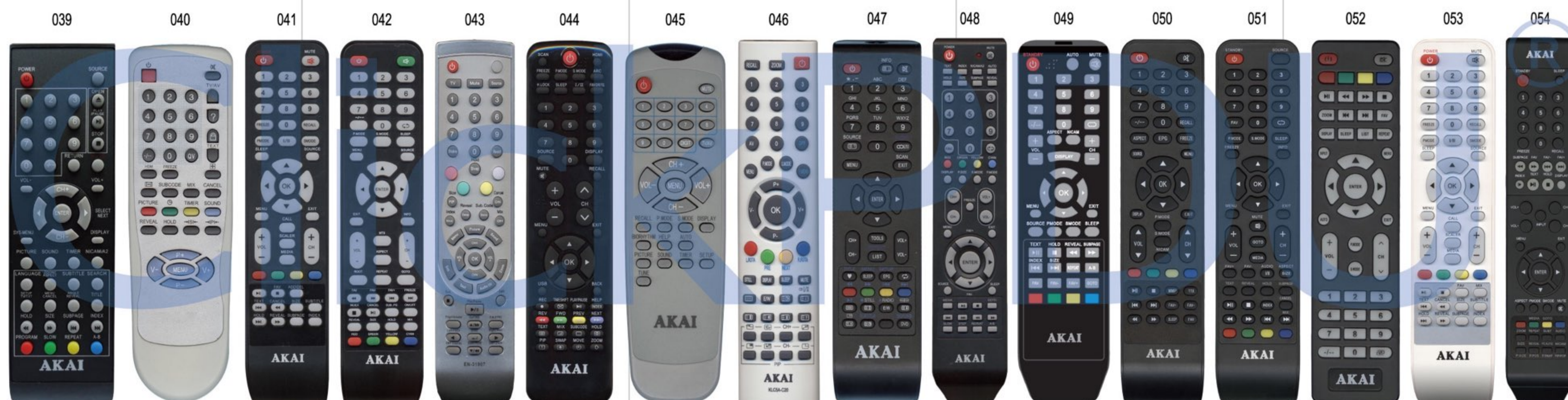
039 ALED2402 040 BT-0384A 041 BT0534 042 CX-507 043 EN-31911 044 HTR-D18A 045 KEX2C-C4 046 KLC5A-C20 047 LEA-19C11P 048 LEA-19V07P 049 LEA-24N20P 050 LEA-32B27M 051 LEA-32B49P (BAP2) 052 LEA-32B49P 053 LEA-32M19P 054 LEA-32S02P