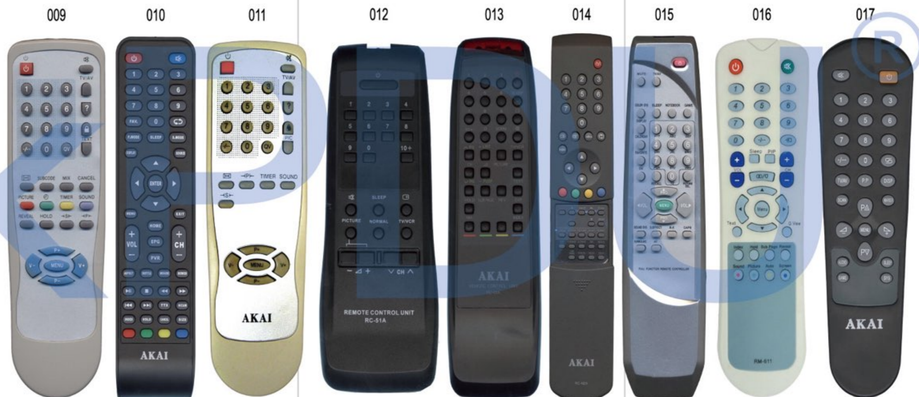
Akai BT-0360A Akai LES-32X92M AKAI M-105 Akai RC-51A Akai RC-61A AKAI RC-N1A, RC-N2A Akai RC-W001 Akai RM-610, RM-611 Akai XY-KJ003